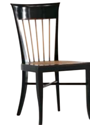
Art. 640 Finitura: NC nero coloniale Paglia di vienna