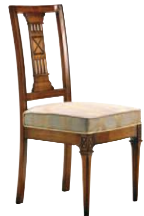
Art. C655 Finitura: 64 Tessuto Ninette 003 Cat. B1