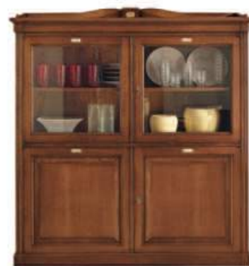
Art. C907B 156X43 h.158/168