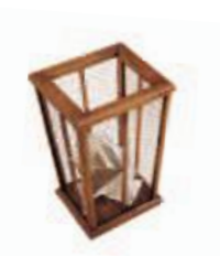
Art. C525 26X26X h.39