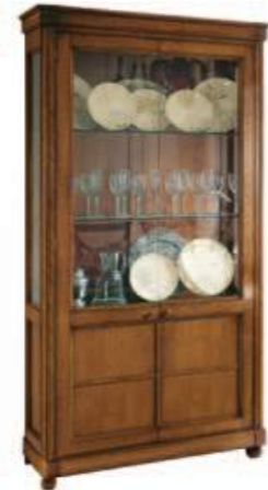
Art. C919 105X43X h.200