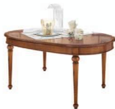
Art. C084 - S