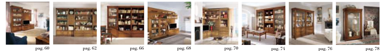
pag. 60 pag. 62 pag. 66 pag. 68 pag. 70 pag. 74 pag. 76 pag. 78