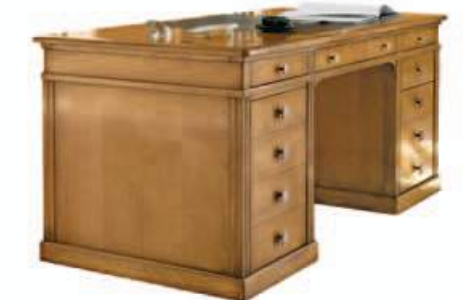
Art. C070N 170X85X h.76