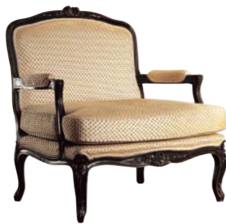
Art. A644 Finitura: NC nero coloniale Tessuto Praline 5107 875 Cat. B2