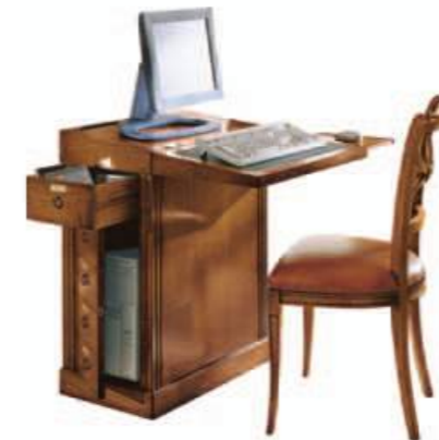
Art. C062 63X38X h.85 aperto 63x76 h.74/81