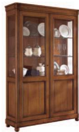
Art. C913 130X43 h.200