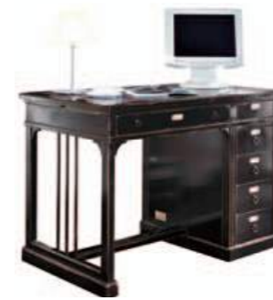
Art. C063 110X65X h.76