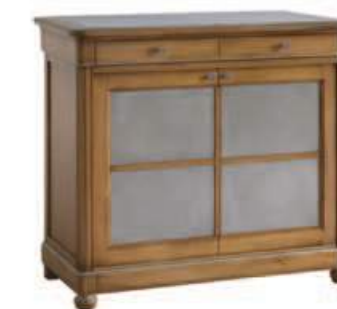
Art. C916P 115X54 h.101 Ante in peltro