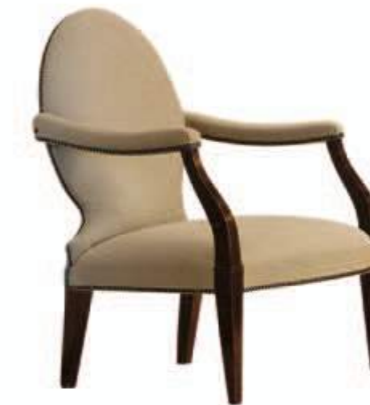
Art. 649 Finitura: NC nero coloniale Tessuto Argentera TF705 C.003 opale Cat. B1