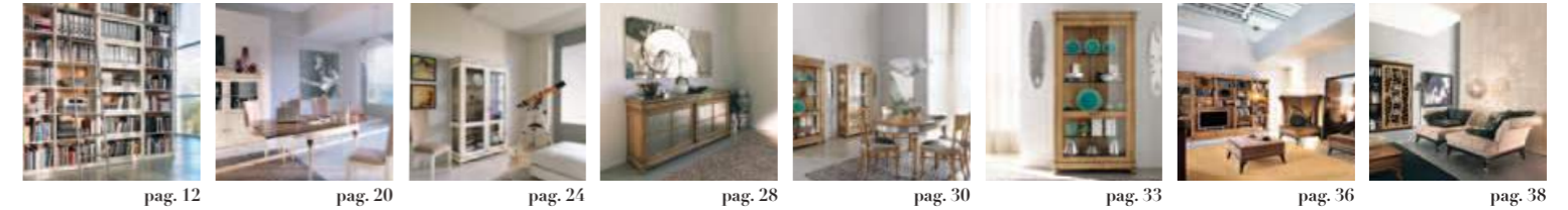
pag. 12 pag. 20 pag. 24 pag. 28 pag. 30 pag. 33 pag. 36 pag. 38