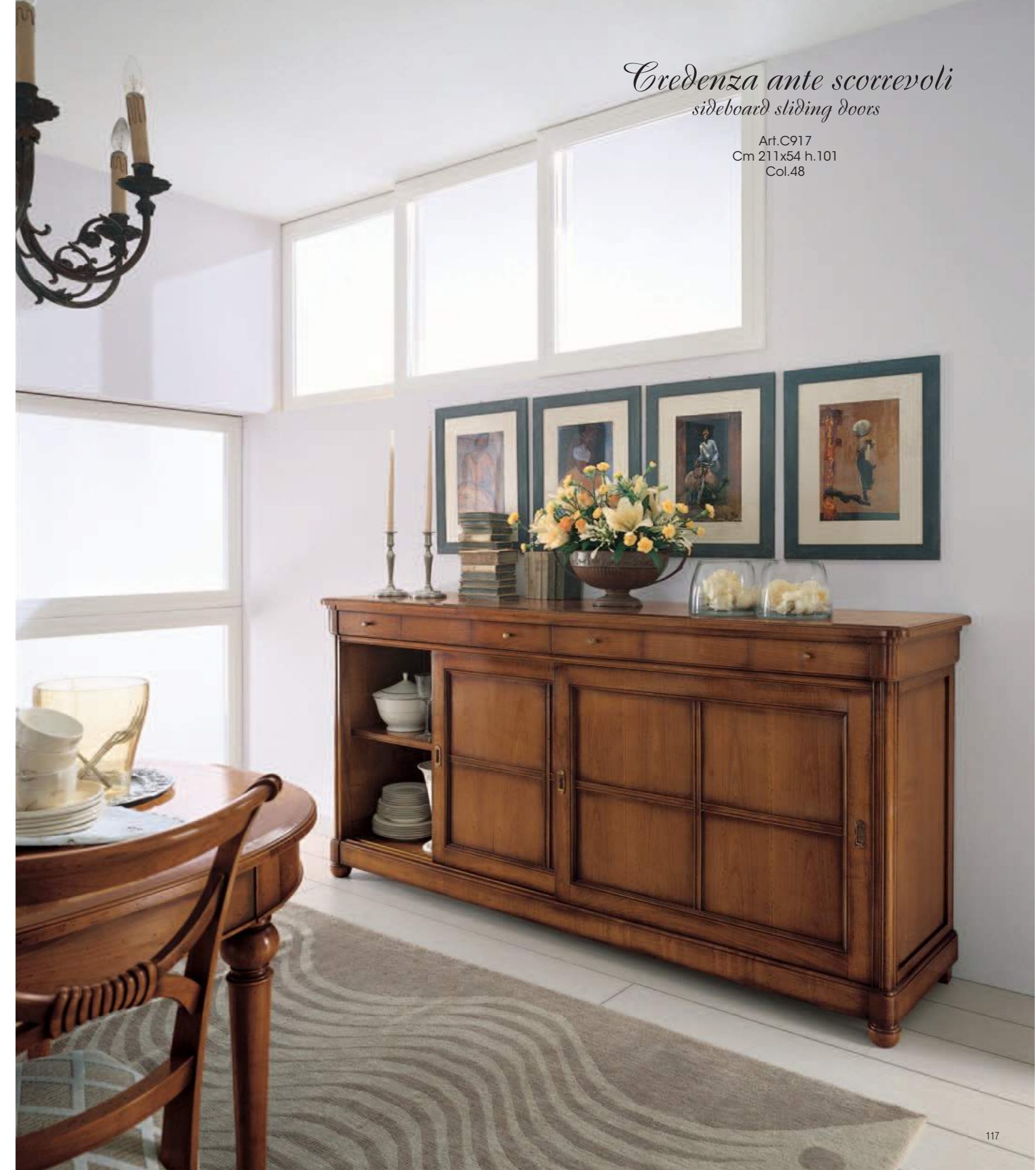
Credenza ante scorrevoli sideboard sliding doors

Richness also in details and craftsmanship in the finishes that set the value of a beauty that is born from details and the prestige of a timeless luxury.