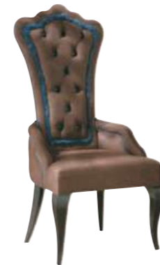
Art. 679 Finitura: NC nero coloniale Tessuto Marwari 2410 Cat. B