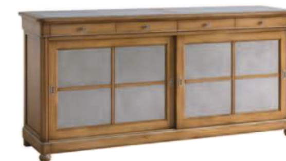
Art. C917P 211X54 h.101 Ante scorrevoli in peltro