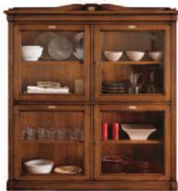
Art. C907 156X43 h.158/168