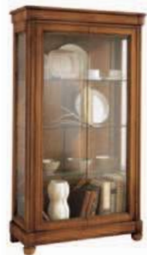
Art. C918 86X39X h.155