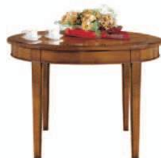
Art. C085 - S