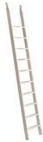
Scala in legno Wooden stair