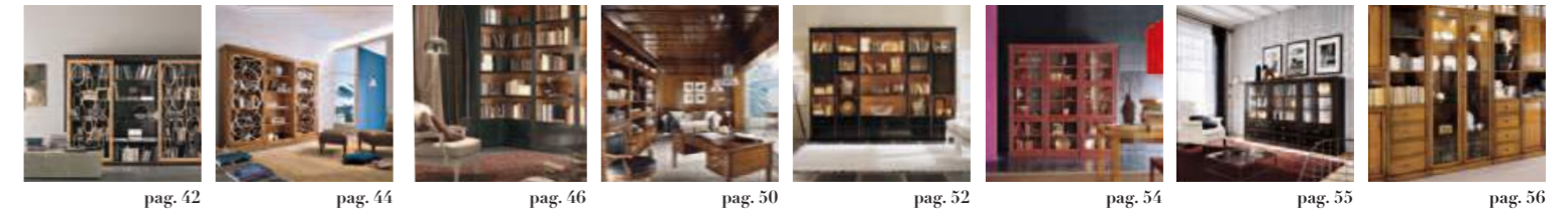
pag. 42 pag. 44 pag. 46 pag. 50 pag. 52 pag. 54 pag. 55 pag. 56