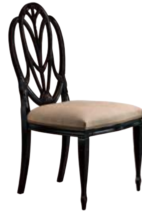
Art. 667 Finitura: NC nero coloniale Tessuto Lino grezzo Cat. B2