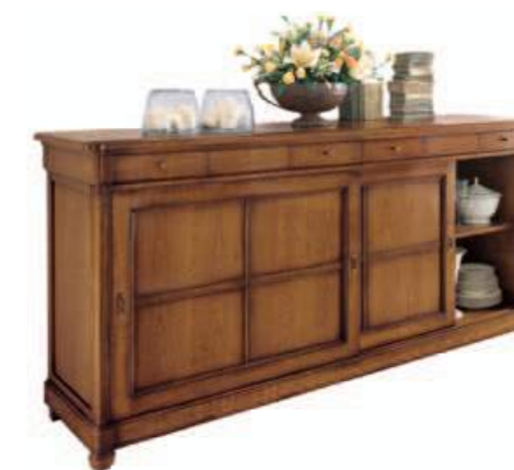
Art. C917 211X54 h.101 Ante scorrevoli