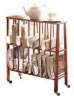
Art. C527 65X23X h.71