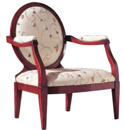
Art. 650 Finitura: RI rosso inglese Pelle anita 15209 871 beige Cat. B3