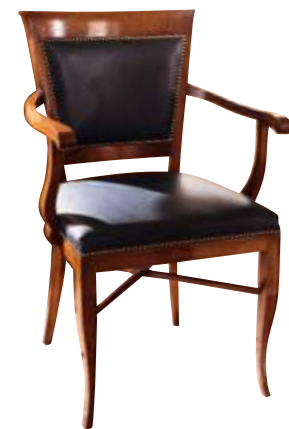
Art. C639 Finitura: 48 Pelle nera T.di moro Cat. C