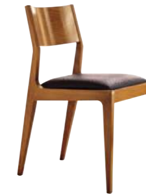
Art. s643 Finitura: 50 Ecopelle marrone