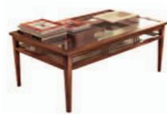
Art. C077 114X69X h.45