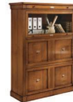
Art. C908 108X43 h.144