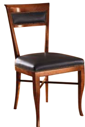
Art. C638 Finitura: 48 Pelle nera T.di moro Cat. C