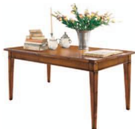
Art. C082 - S