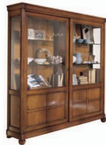
Art. C920 197X43X h.206 Ante scorrevoli