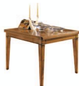
Art. C083 - S