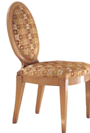
Art. 676 Finitura: 60 Tessuto Martini 15204 188 Cat. B3