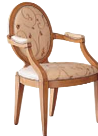
Art. 677 Finitura: 60 Pelle anita 15209 871 beige Cat. B3