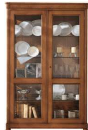
Art. C913B 130X43 h.200