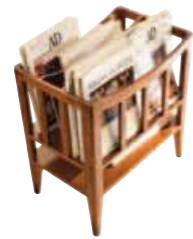
Art. C526 45X28X h.49