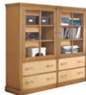
Art. CL059 151X39 h.137,5