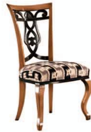
Art. 669 Finitura: 64+NC nero coloniale Tessuto Kabala 1089.6 Cat. B1