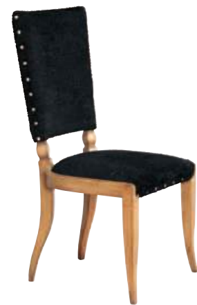
Art. C681 Finitura: 60 Tessuto Astrakan nero Cat. B2