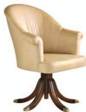
Art. C671 Finitura: TS terra di Siena Pelle cocco sabbia Cat. C