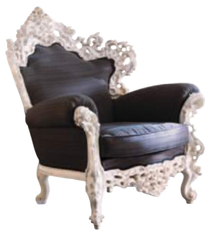
Art. 647 Finitura: BG bianco gessato Tessuto Gros de suez TF703 C.007 pervinca Cat. B1