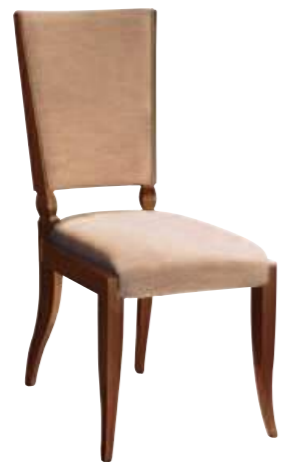
Art. C682 Finitura: NC nero coloniale Tessuto Libussa 1064.3 Cat. B1