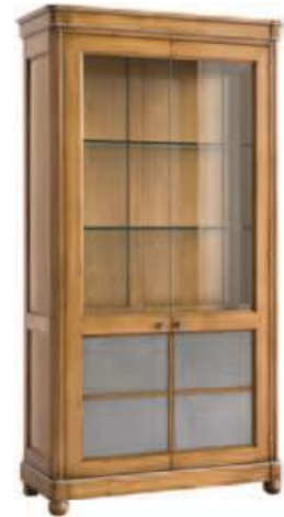
Art. C919P 105X43X h.200 Ante in peltro