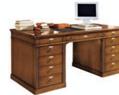
Art. C069 146X76X h.76 146x208 aperto 132x36 piano dattilo