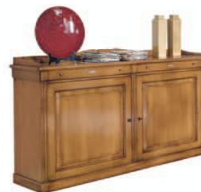
Art. C906 181X54 h.102/112