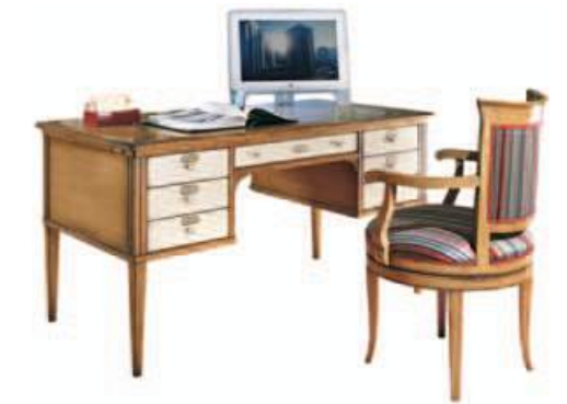
Art. C072 146X76X h.76 Con piano dattilo estraibile