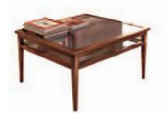
Art. C078 74X74X h.45