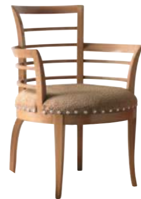
Art. 675 Finitura: 60 Tessuto Leon 884 Cat. B1