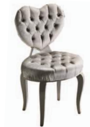
Art. 661 Finitura: PL pallas Tessuto Pallas 206 Cat. B2