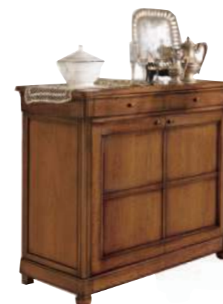
Art. C916 115X54 h.101