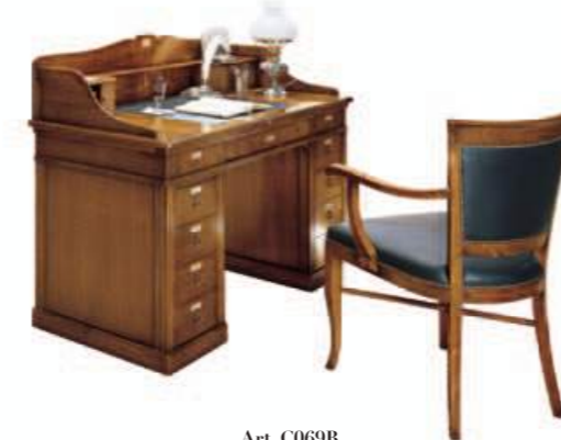
Art. C069B 146X76X h.76/106 146x208 aperto 132x36 piano dattilo