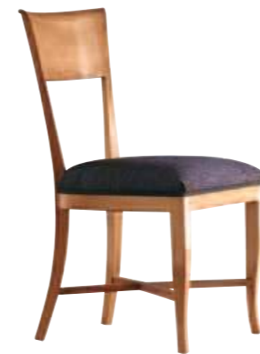
Art. 634 Finitura: 64 Tessuto Libussa 1064.12 Cat. B1