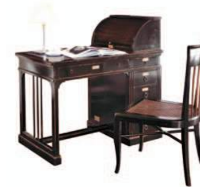
Art. C064 110X65X h.76/109