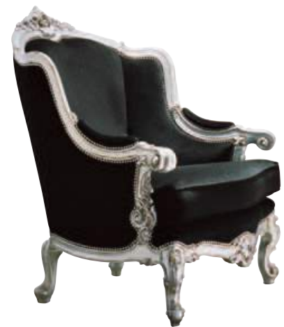
Art. 646 Finitura: AR foglia argento Tessuto Velluto nero Cat. B1