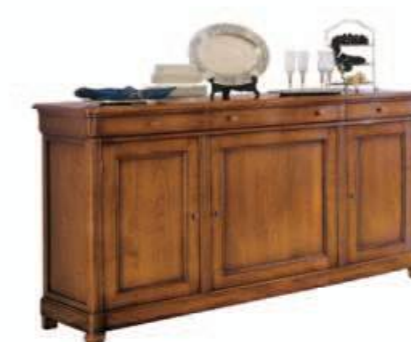
Art. C912 184X54 h.101