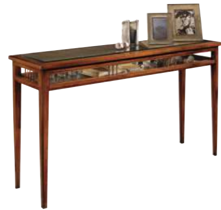
Art. C076 132X39X h.74