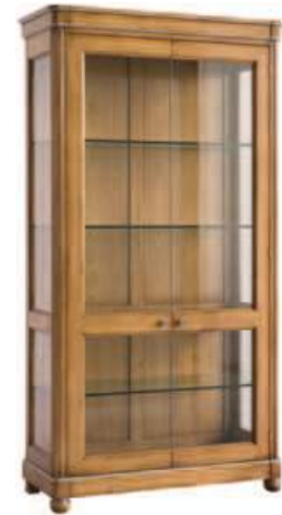
Art. C919B 105X43X h.200