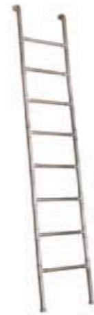
Scala in acciaio Steel stair