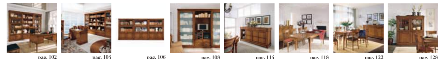
pag. 102 pag. 104 pag. 106 pag. 108 pag. 114 pag. 118 pag. 122 pag. 128