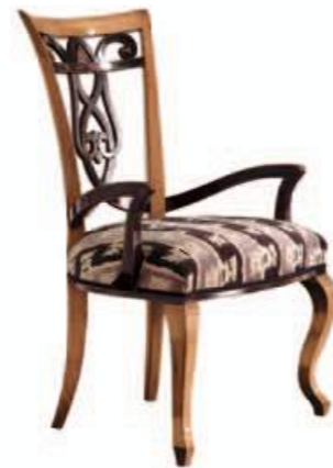
Art. 670 Finitura: 64+NC nero coloniale Tessuto Kabala 1089.6 Cat. B1