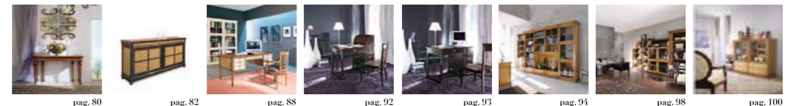
pag. 80 pag. 82 pag. 88 pag. 92 pag. 93 pag. 94 pag. 98 pag. 100