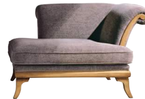
Art. C660 Finitura: 60 Tessuto Rex coffee minstrel Cat. B3