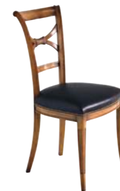
Art. C636 Finitura: 48 Pelle nera T.di moro Cat. C