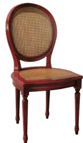
Art. 633 Finitura: RV rosso vivo Paglia di vienna