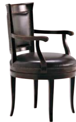
Art. C639 Z Finitura: NC nero coloniale Pelle nera T.di moro Cat. C