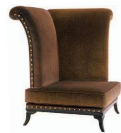
Art. C663 Finitura: NC nero coloniale Tessuto Macrame' 1131.56 Cat. B1