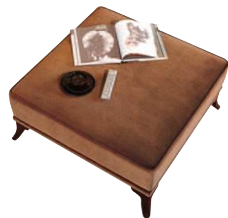
Art. C664 Finitura: NC nero coloniale Tessuto Macrame' 1131.56 Cat. B1