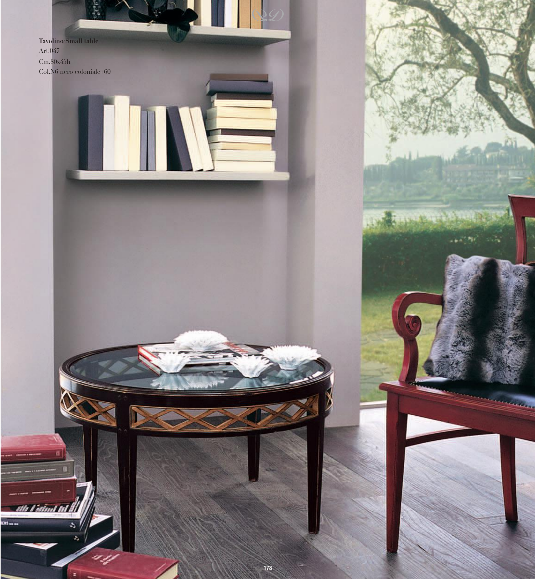
Tavolino/Small table Art.047 Cm.80x45h Col.N6 nero coloniale+60