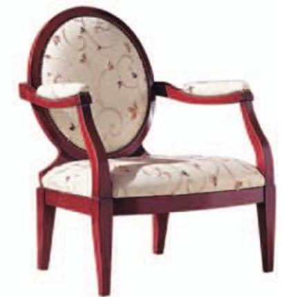
Art. 650 Finitura: RI rosso inglese Tessuto Pelle anita 15209 871 beige Cat. B1