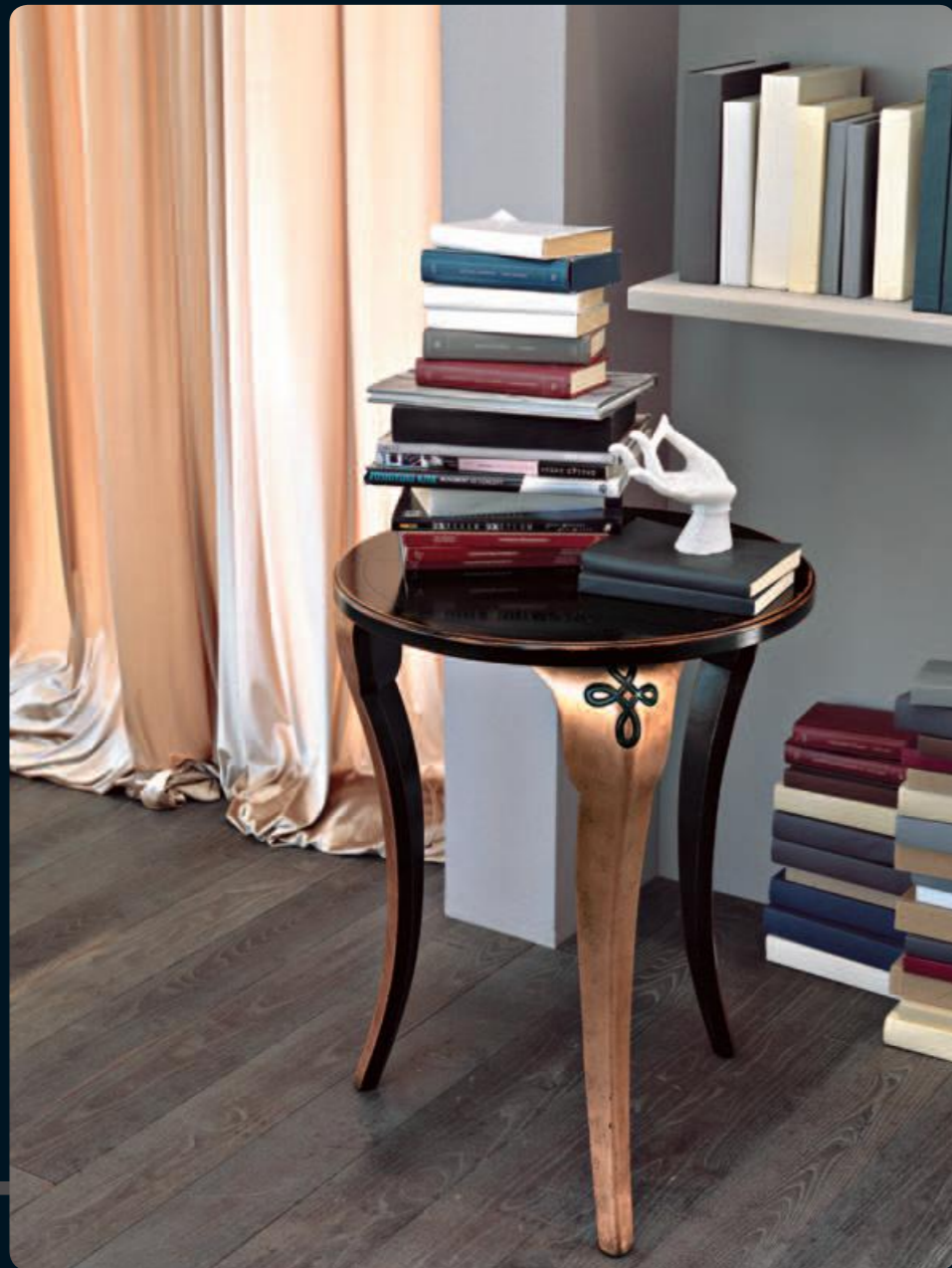
Tavolino/Small table Art.553 Cm.56,5x70h Col.NC +RA - nero coloniale+foglia rame

Le forme del legno, sinuose ed eleganti, diventano protagonisti di veri pezzi da collezione.