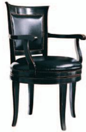
Art. C639 Z Finitura: NC nero coloniale Pelle nera T.di moro Cat. C