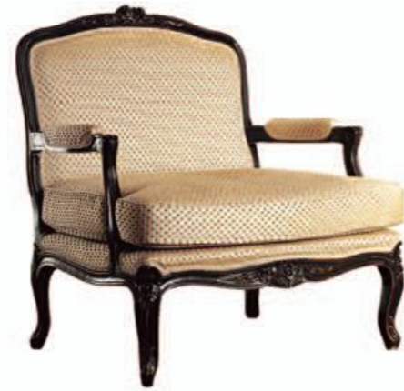
Art. A644 Finitura: NC nero coloniale Tessuto Praline 5107 875 Cat. B2