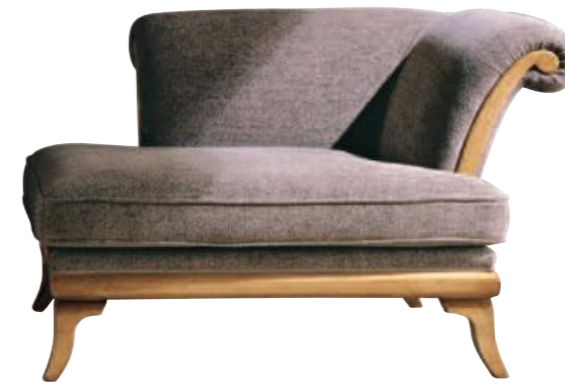
Art. C660 Finitura: 60 Tessuto Rex coffee minstrel Cat. B3