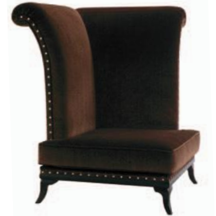
Art. C663 Finitura: NC nero coloniale Tessuto Macrame' 1131.56 Cat. B1