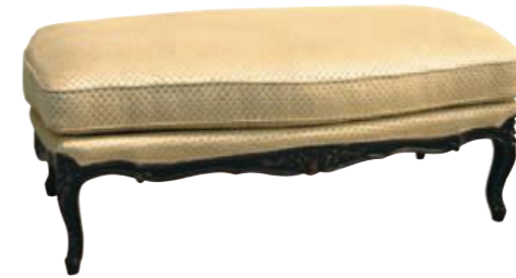
Art. A645 Finitura: NC nero coloniale Tessuto Praline 5107 875 Cat. B2