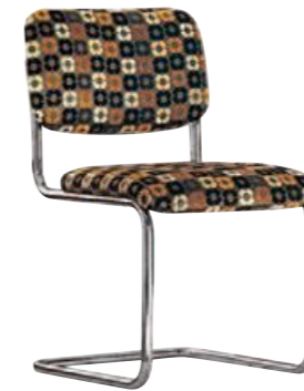
Art. 659 Finitura: - Tessuto Martini 15204 878 Cat. B3