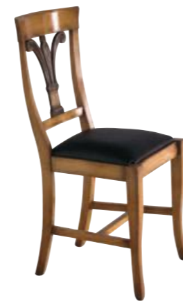
Art. 653 Finitura: 64+NC nero coloniale Pelle nera T.di moro Cat. C