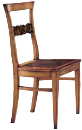
Art. 624 Finitura: N6 60+nero coloniale Paglia di vienna