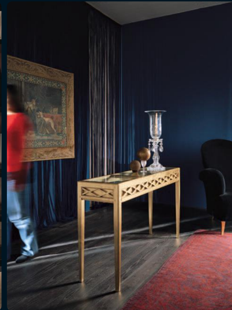
Consolle/console Art.507F Cm.128x35x74h Col.OR foglia oro

Consolle dalle linee semplicemente perfette, nate dall'intenzione di Bizzotto di proporre qualcosa di veramente alternativo.