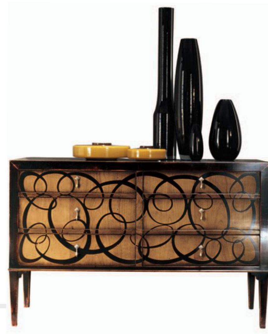
Comò/Chest of Drawers Art.C361 E Cm.141x50x90h Col.N5 nero coloniale + 50

Ellissi, geometrie che si rincorrono, linee che eleganti disegnano uno stile. Ovals, geometric shapes that mingle with each other, elegant lines that depict a style.