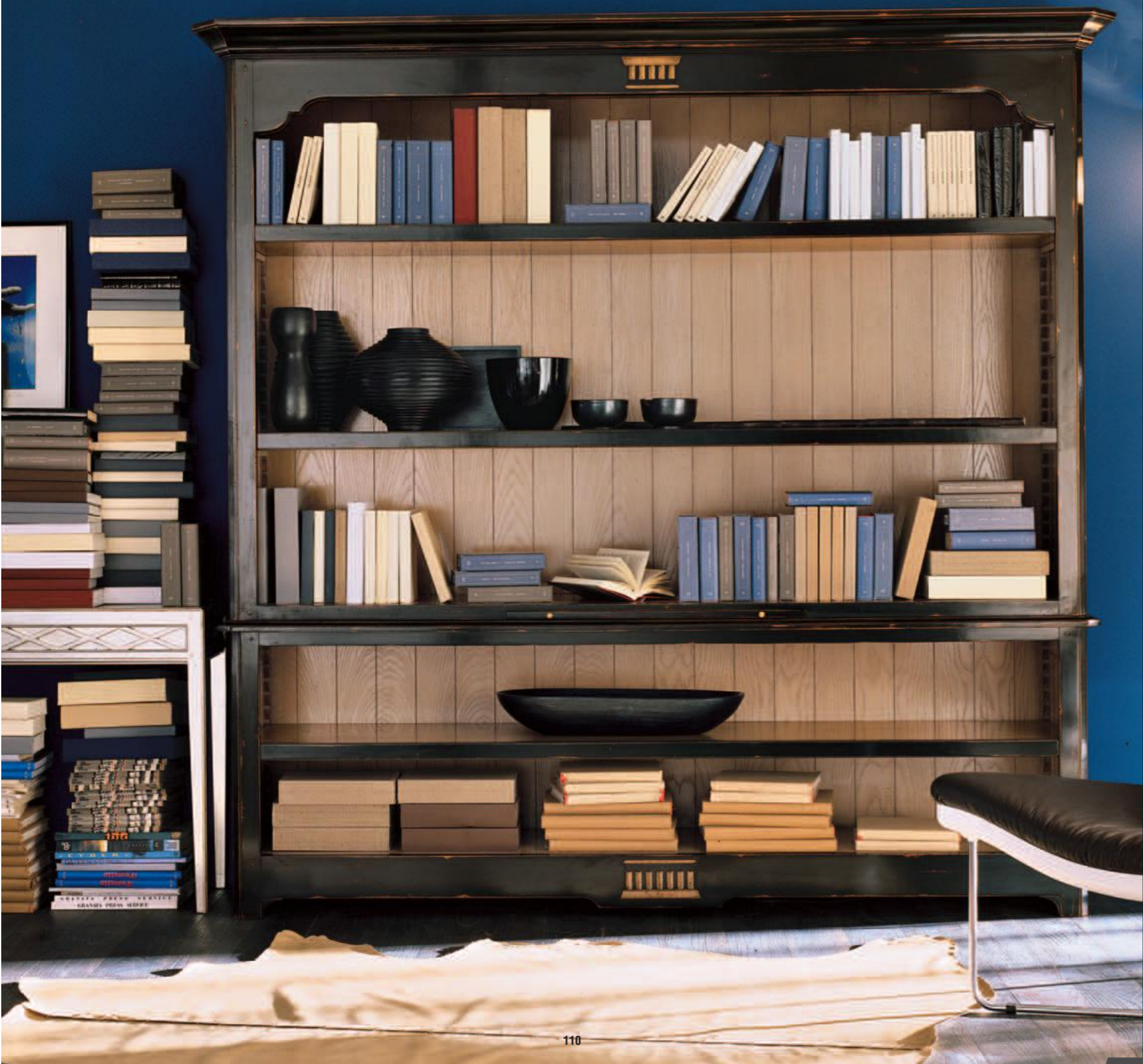
Libreria/bookcase Art.C937 Cm.215x48x212h Col.NC nero coloniale