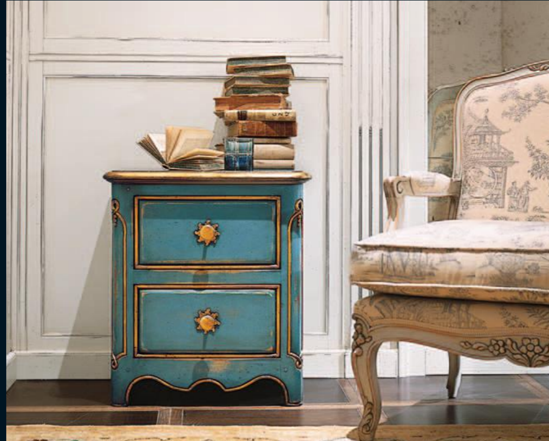
Comodino/bedside table Art.343 Cm.54x36x61h Col.TO turchese+oro