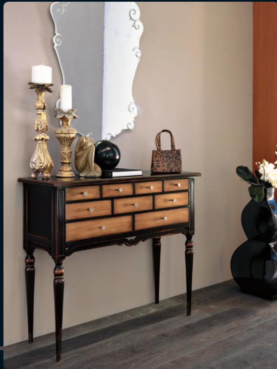
Mobiletto/small chest of drawers Art.503 Cm.101x37x85h Col.N5 nero coloniale+50

Idee nuove che trovano la loro dimensione negli infiniti giochi di forme e colori. New ideas that find their dimensions in the endless variety of shapes and colours.