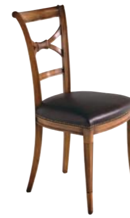
Art. C636 Finitura: 48 Pelle nera T.di moro Cat. C