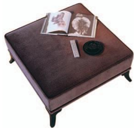
Art. C664 Finitura: NC nero coloniale Tessuto Macrame' 1131.56 Cat. B1