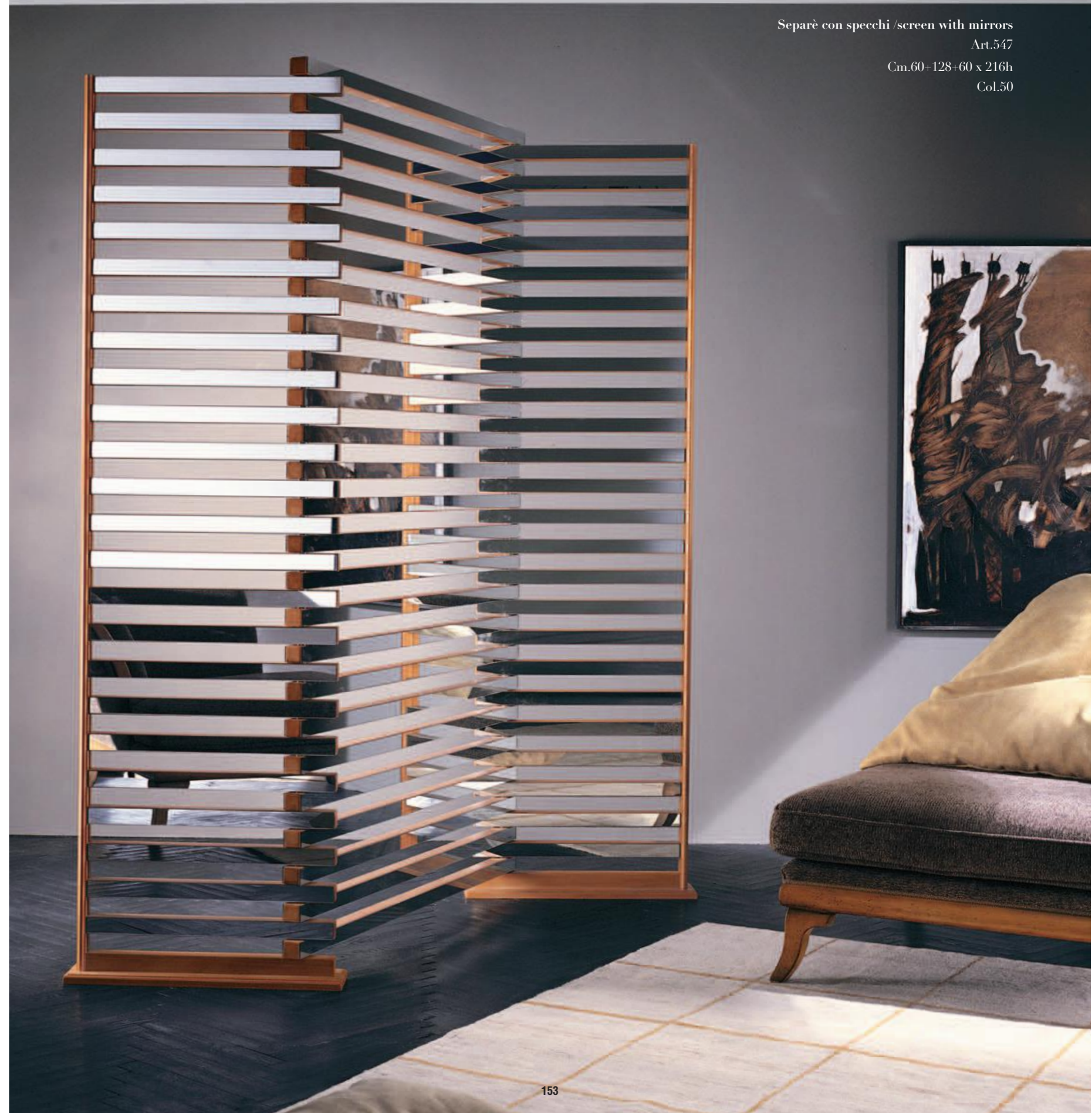
Separè con specchi /screen with mirrors Art.547 Cm.60+128+60 x 216h Col.50

Transparencies that conceal details, Bizzotto transforms the concept of the screen.