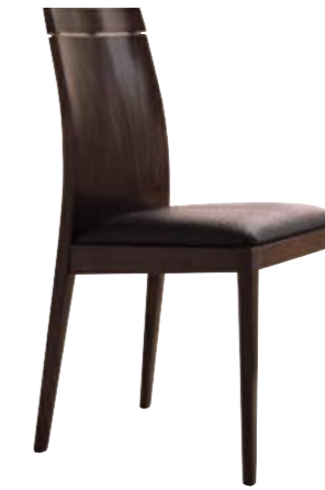
Art. S642 Finitura: 58 Ecopelle marrone