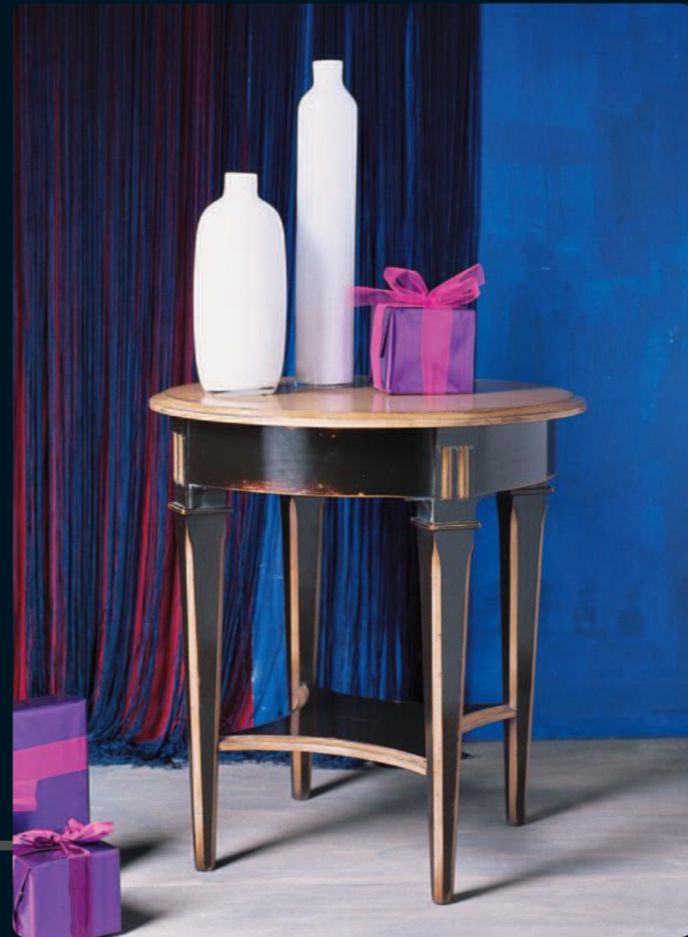
Tavolino/Small table Art.C099 Cm.66x70h Col.N6 nero coloniale+60

La Collezione Montségur esprime in realtà la grande voglia di cambiamento all'insegna degli stili e le tendenze del nostro tempo.