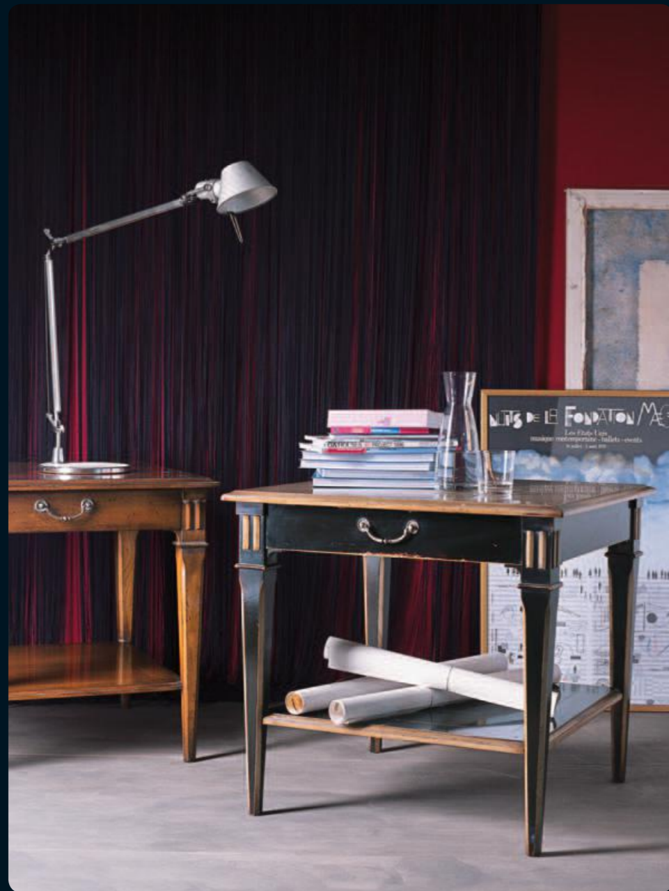
Tavolino/Small table Art.C098 Cm.76x76x70h Col.62 - Col.N6 nero coloniale+60