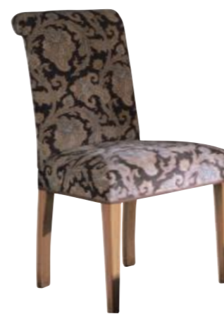
Art. 651 Finitura: 60 Tessuto Budir 004 Cat. B3