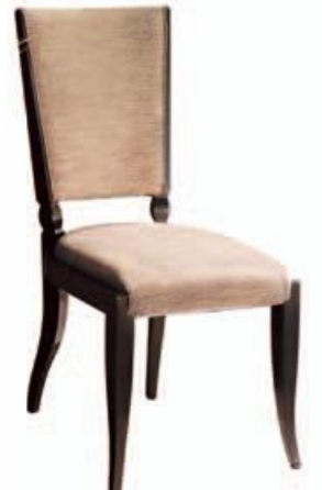
Art. C682 Finitura: NC nero coloniale Tessuto Libussa 1064.3 Cat. B1