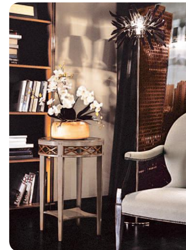
Tavolino/Small table Art.046 Cm.50x73h Col.OS ostrica + 62

Piccoli tavoli che completano ambientazioni raffinate, realizzati in base alle esigenze e ai gusti di chi ama differenziarsi.