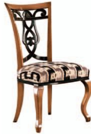
Art. 669 Finitura: 64+NC nero coloniale Tessuto Libussa 1089.6 Cat. B1