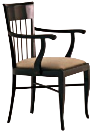
Art. 641 Finitura: NC nero coloniale Tessuto Lino grezzo Cat.B2