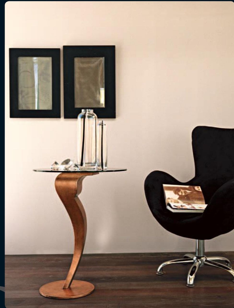
Tavolino/Small table Art.551 Cm.60x70h Col.RA foglia rame

The sinuous, elegant shapes of the wood, become the protagonists of real collection pieces.