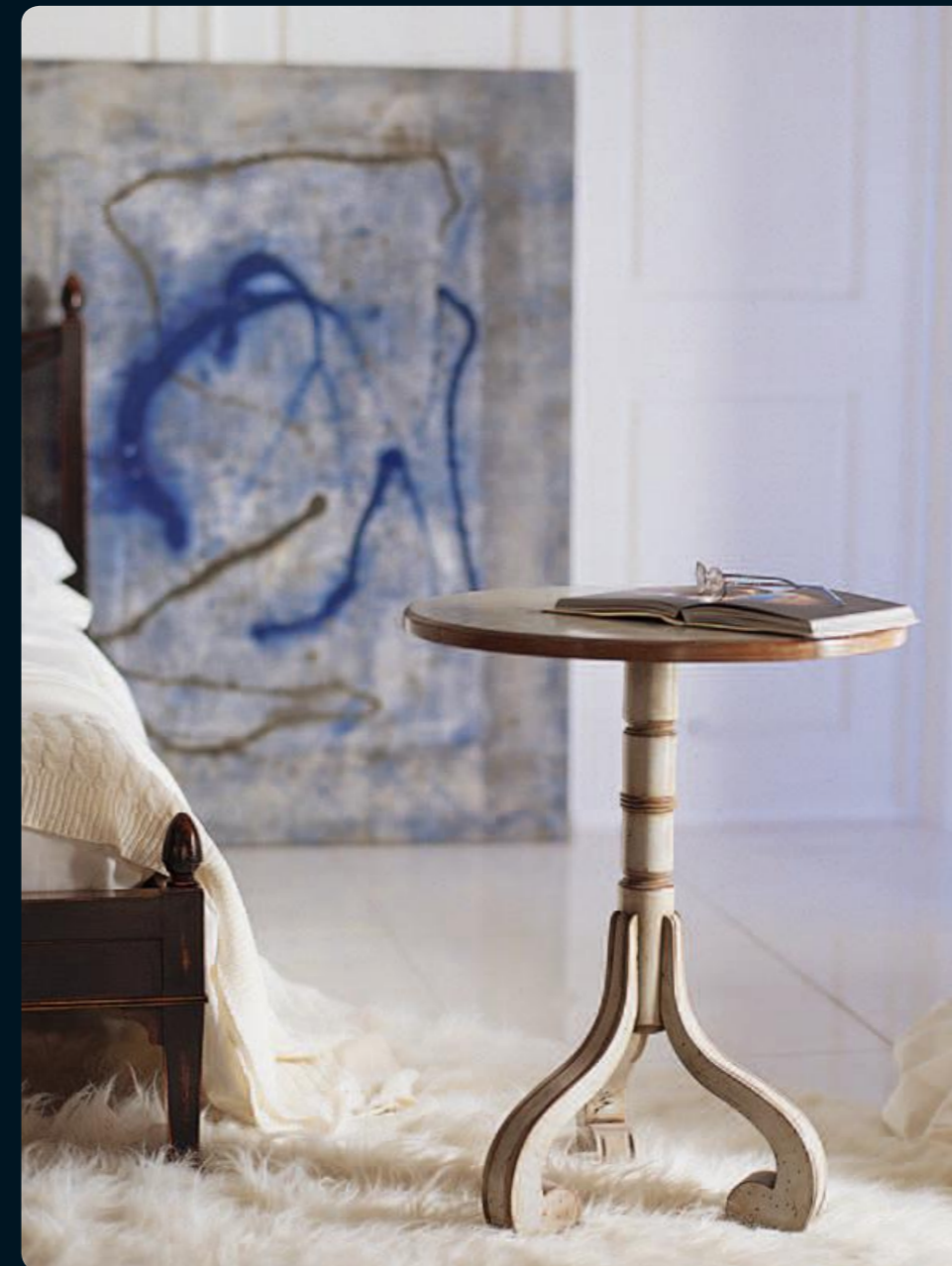
Tavolino/Small table Art.A529 Cm.55x70h Col.AC azzurro cenere

Una collezione fatta di numerose proposte per vivere gli spazi, i colori e le forme, un divertente alternarsi di complementi dal design fusion.