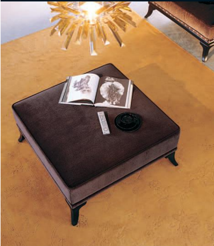
Pouf Art.C664 Tessuto "Macramè 1131.56" cat.B1 Col.NC nero coloniale