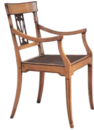
Art. 632 Finitura: T6 terra di siena+60 Paglia di vienna