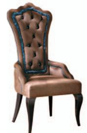
Art. 679 Finitura: NC nero coloniale Tessuto Marwari 2410 Cat. B