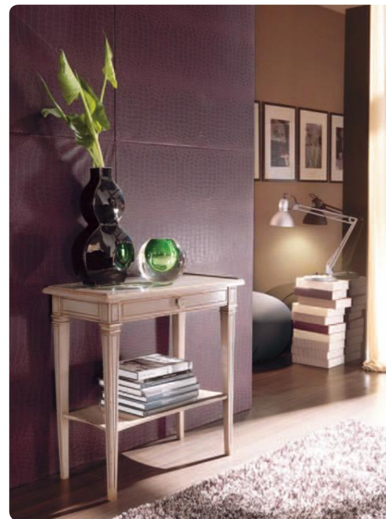
Tavolino/Small table Art.511/N Cm.73x38x73h Col.OS Ostrica

La Collezione Trésor è sinonimo di stile e raffinatezza, concetti essenziali per chi vuole imprimere un tocco personale al proprio ambiente casa.