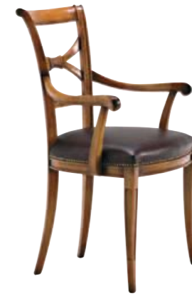
Art. C637 Finitura: 48 Pelle nera T.di moro Cat. C