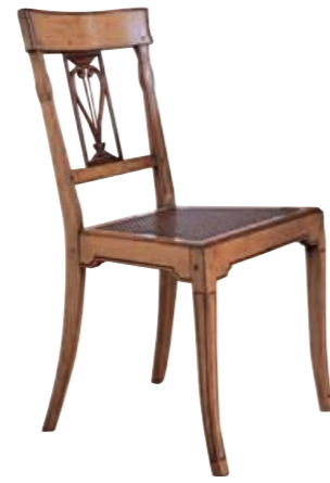
Art. 631 Finitura: T6 terra di siena+60 Paglia di vienna