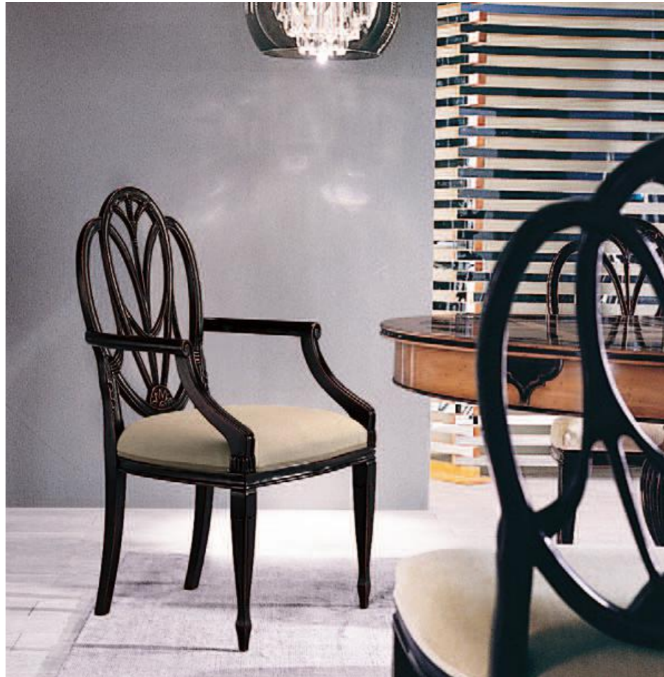
Poltroncina/armchair Art.668 Tessuto "Lino grezzo" Cat.B2 Col.NC nero coloniale

Tessuti preziosi, laccature luminose, intarsi magistrali, la Collezione S. Pietroburgo sa ricreare atmosfere dal sapore antico.