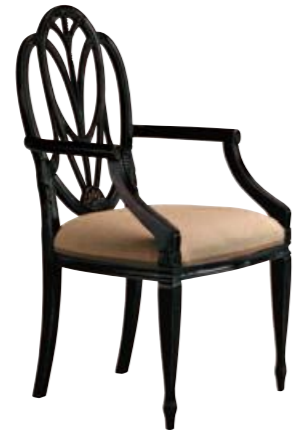
Art. 668 Finitura: NC nero coloniale Tessuto Lino grezzo Cat. B2