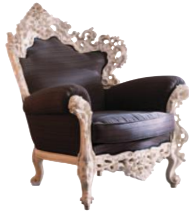
Art. 647 Finitura: BG bianco gessato Tessuto Gros de suez TF703 C.007 pervinca Cat. B1