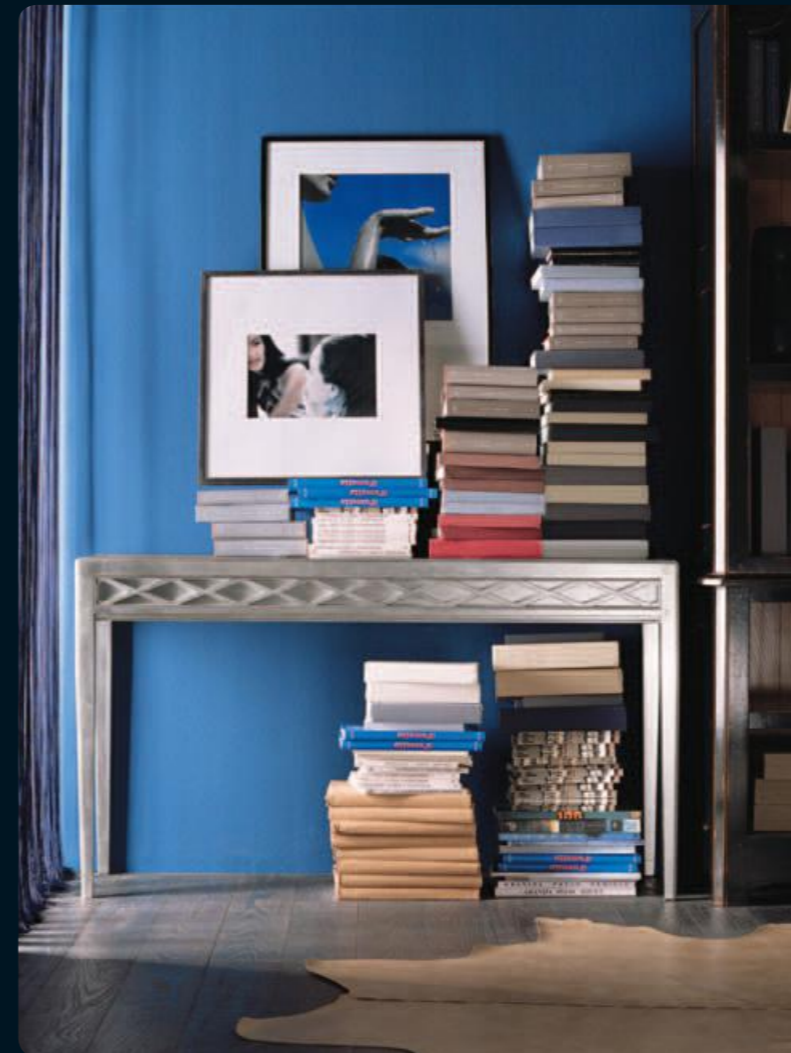
Consolle/console Art.507B Cm.128x35x74h Col.AR foglia argento

Pure white is the colour expressed in classic forms thereby reinforcing the concept of elegance.