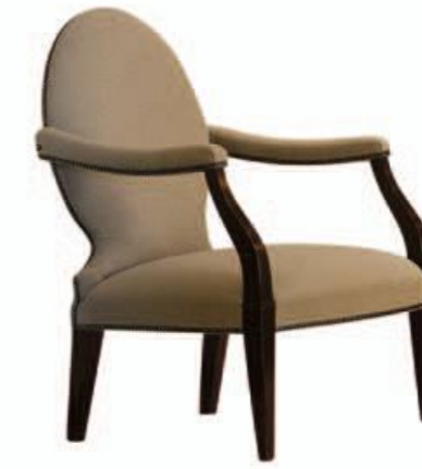
Art. 649 Finitura: NC nero coloniale Argentera TF705 C.003 opale Cat. B1