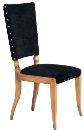
Art. C681 Finitura: 60 Tessuto Astrakan nero Cat. B2