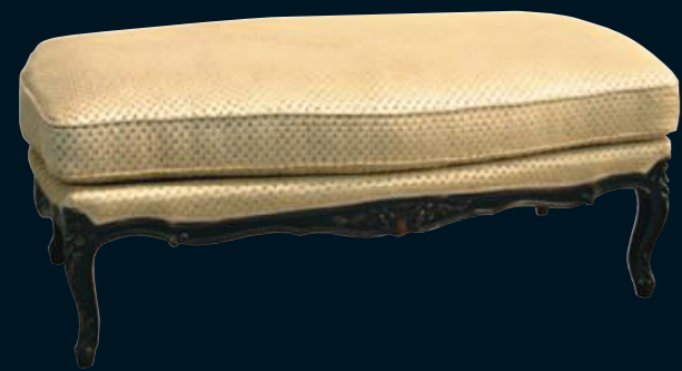
Pouf Art.A645 Tessuto "Praline 5107 875" Cat.B2 Col.NC nero coloniale