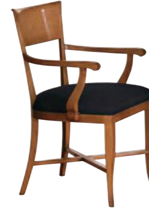
Art. 635 Finitura: 64 Tessuto Libussa 1064.12 Cat. B1