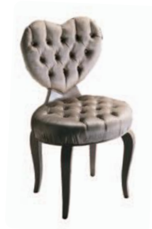
Art. 661 Finitura: PL pallas Tessuto Pallas 206 Cat. B2