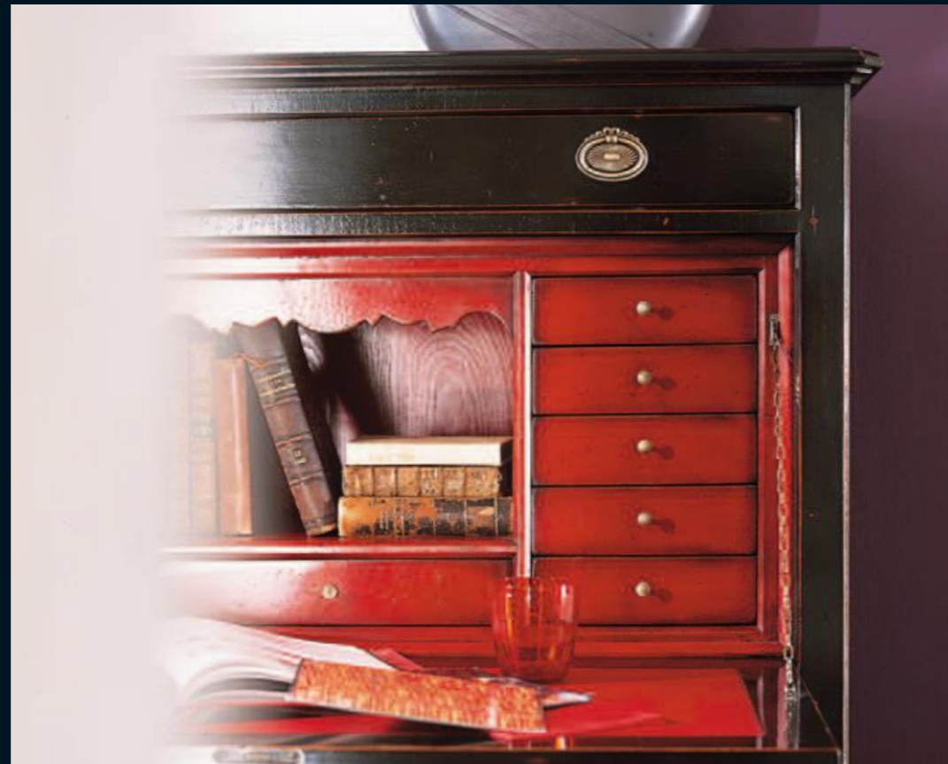
Secrétaire Art.520 Cm.112x51x140h Col.NC nero coloniale+interno rosso vivo