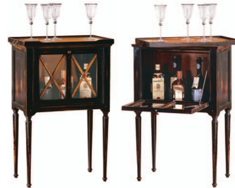
Mobiletto bar / Cocktail cabinet Art.517 CM.56x34x87h Col.NC nero coloniale

Legni pregiati provenienti da ogni parte del mondo, lavorati con straordinaria professionalità e impreziositi da laccature di esaltante dinamismo.