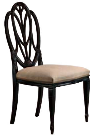
Art. 667 Finitura: NC nero coloniale Tessuto Lino grezzo Cat. B2