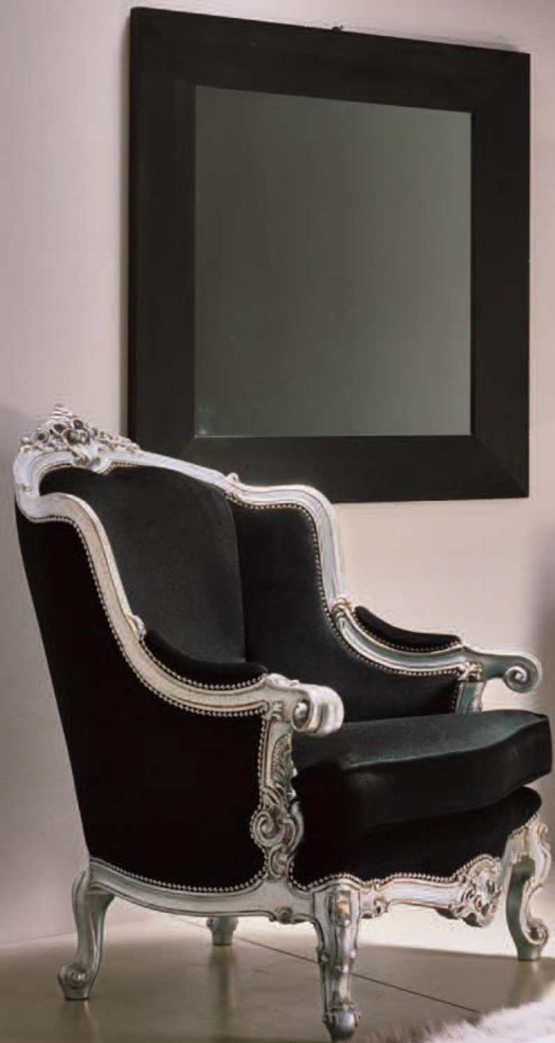
Poltrona intagliata / armchair Art.646 Tessuto "Velluto nero" Cat.B1" Col.AR Foglia argento