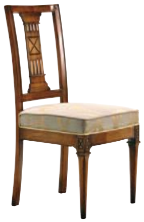
Art. C655 Finitura: 64 Tessuto Ninette 003 Cat. B1