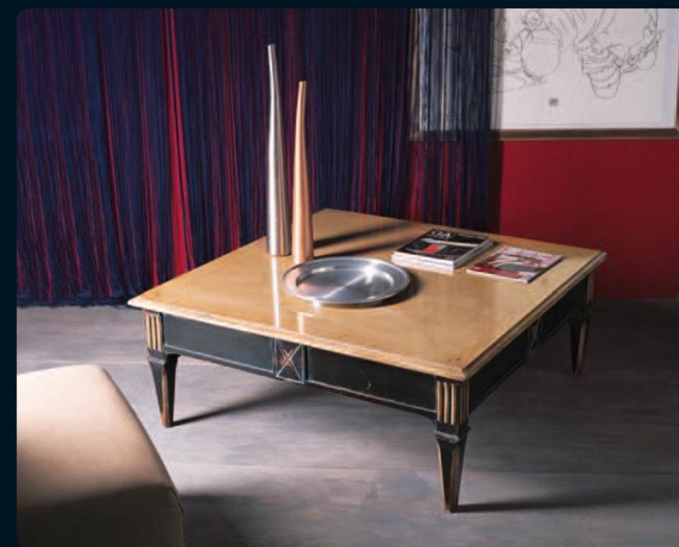
Tavolino/Small table Art.C097 Cm.120x120x45,5h Col.N6 nero coloniale+60

Appoggiare, scrivere, raccogliere: le funzioni di un tavolo e la bellezza dei suoi particolari.