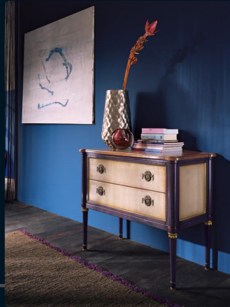
Comoncino/Small chest of drawers Art.506 Cm. 103x49x85h Col.VB viola bianco

La zona giorno lancia la sua sfida, essere la parte più importante di un tutto identificandosi con lo stile di chi sceglie.