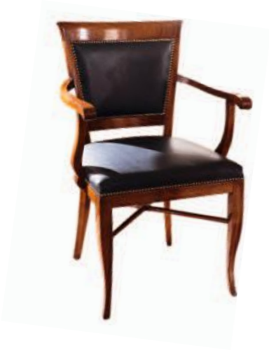
Art. C638 Finitura: 48 Pelle nera T.di moro Cat. C