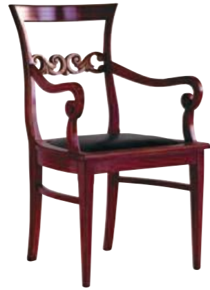
Art. 626 Finitura: RI rosso inglese Pelle nera T.di moro Cat. C