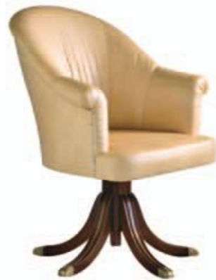
Art. C671 Finitura: NC nero coloniale Pelle cocco sabbia Cat. C