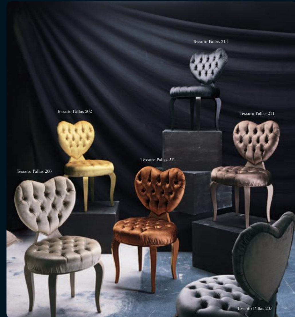
Tessuto Pallas 213