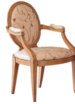
Art. 677 Finitura: 60 Pelle anita 15209 871 beige Cat. B3