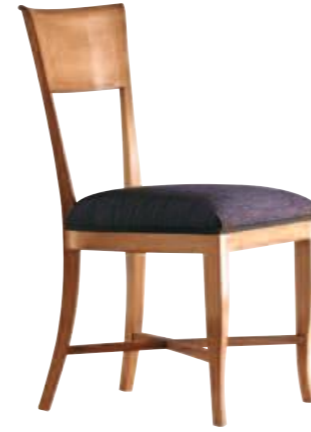
Art. 634 Finitura: 64 Tessuto Libussa 1064.12 Cat. B1