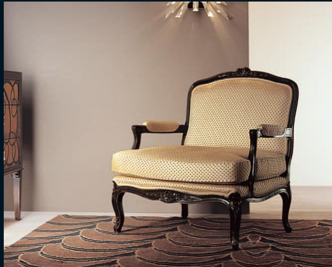
Poltrona intagliata/armchair Art.A644 Tessuto "Praline 5107 875" Cat.B2 Col.NC nero coloniale