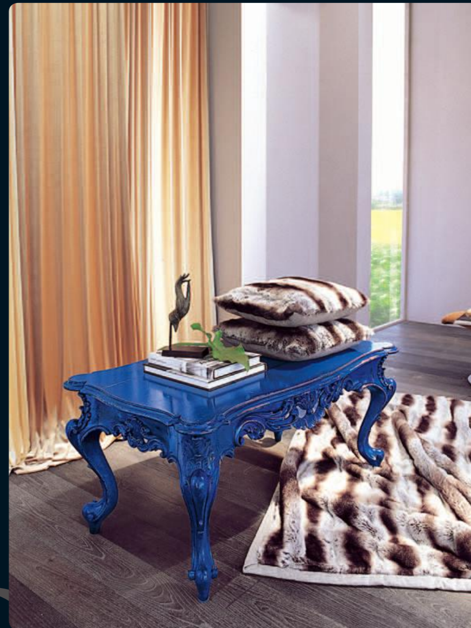
Tavolino intagliato /Small table Art.106 Cm.106x61x49h Col.BO blu oltremare

Idee nuove che trovano la loro dimensione negli infiniti giochi di forme e colori. New ideas that find their dimensions in the endless variety of shapes and colours.