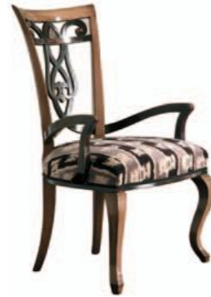
Art. C670 Finitura: 64+NC nero coloniale Tessuto Libussa 1089.6 Cat. B1