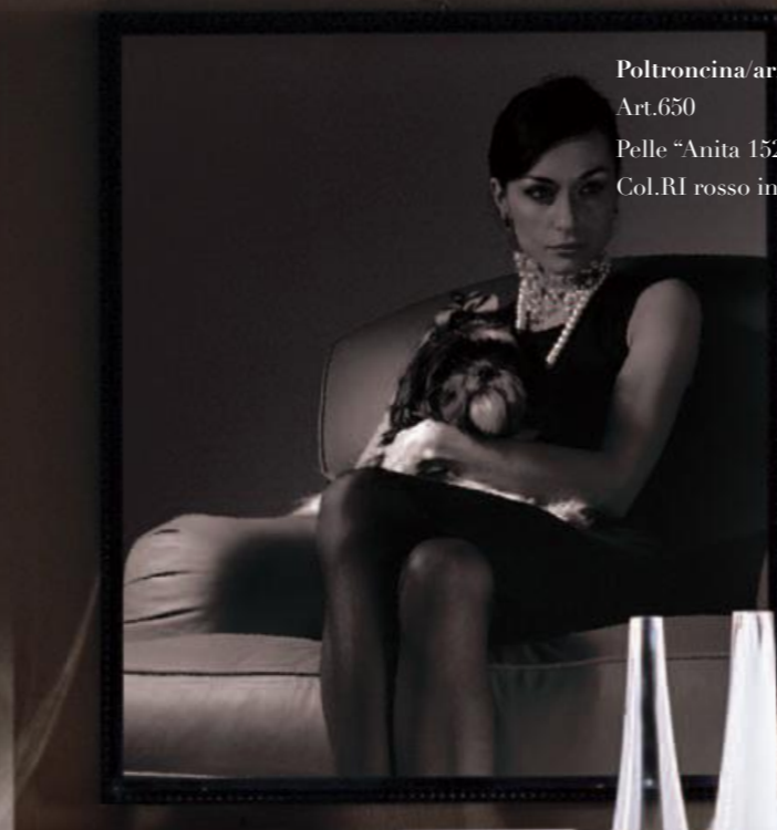
Poltroncina/armchair Art.650 Pelle "Anita 15209 871 beige" Col.RI rosso inglese