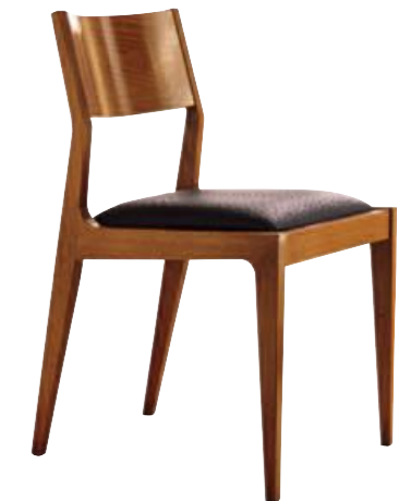
Art. s643 Finitura: 50 Ecopelle marrone