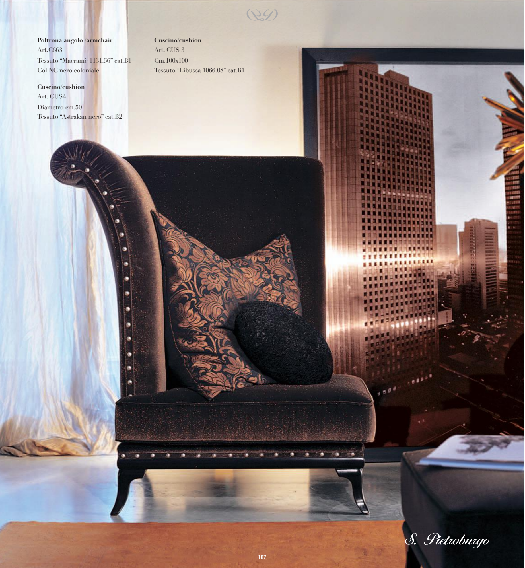
Poltrona angolo / armchair Art.C663 Tessuto "Macramè 1131.56" cat.B1 Col.NC nero coloniale