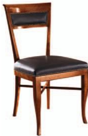
Art. C639 Finitura: 48 Pelle nera T.di moro Cat. C