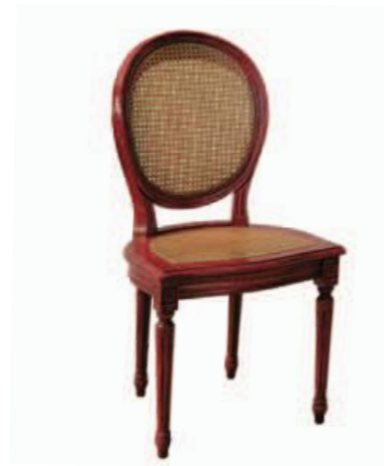
Art. 633 Finitura: RV rosso vivo Paglia di vienna