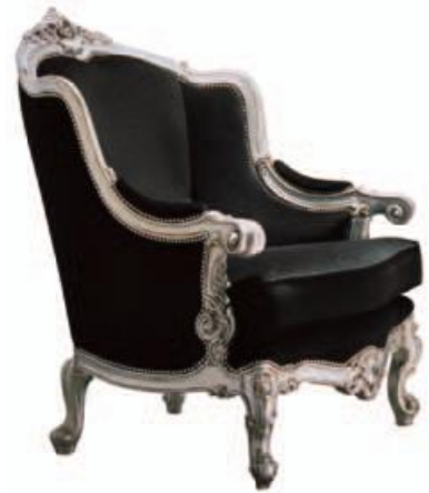
Art. 646 Finitura: AR foglia argento Tessuto Velluto nero Cat. B1