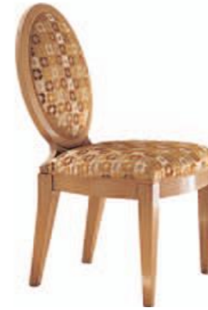
Art. 676 Finitura: 60 Tessuto Martini 15204 878 Cat. B3