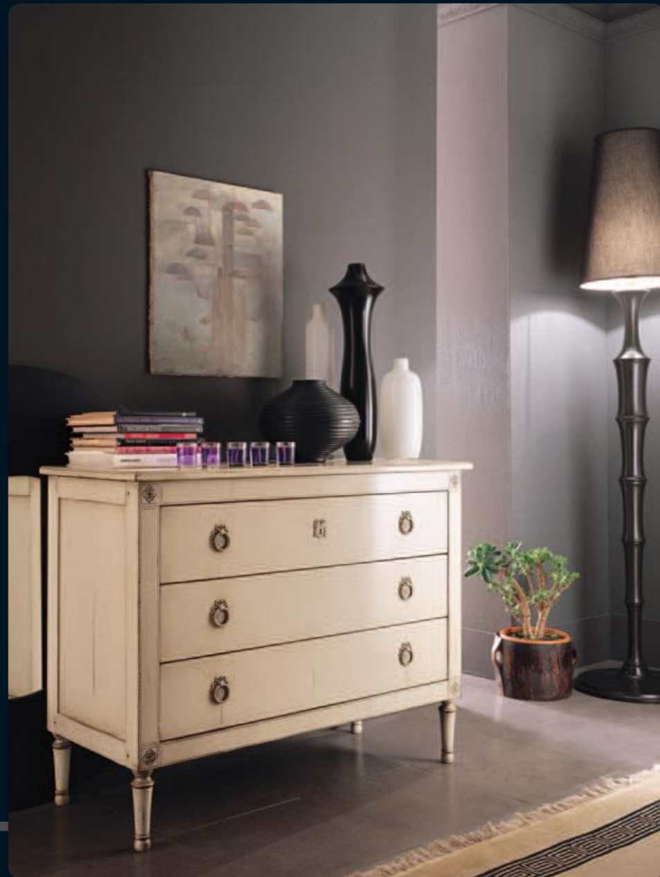
Comò/chest of drawers Art.335 Cm.121x50x93h Col.AB bianco antico

Il bianco colore assoluto si imprime nelle forme classiche rafforzando così il concetto di eleganza.