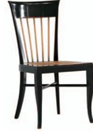
Art. 640 Finitura: NC nero coloniale Paglia di vienna